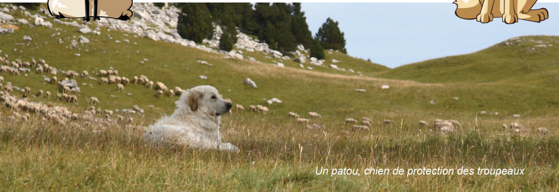
Un patou, chien de protection des troupeaux